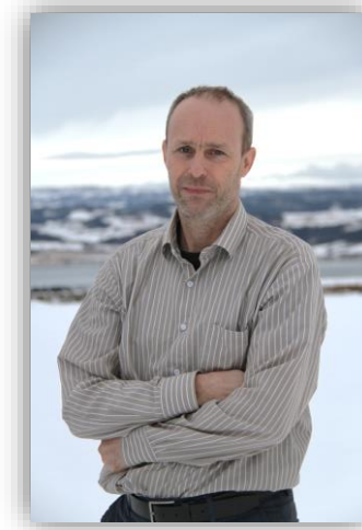
Rune Hedegart Skogproduksjon og klimabidrag