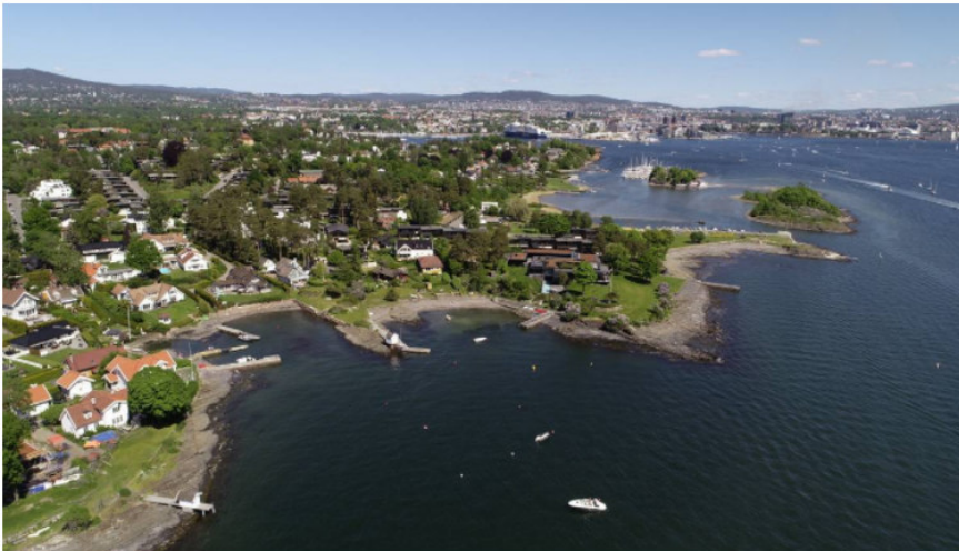
BYGDØY: Få steder er uberørt av mennesker langs Oslofjorden.

To sommerfuglarter er allerede borte. Biologer mener flere arter kan forsvinne dersom regjeringen åpner for mer bygging i strandsonen.