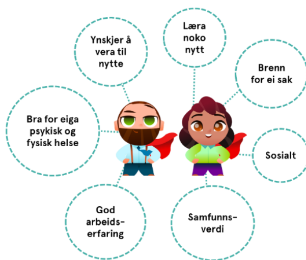
Kva motiverer til frivillig innsats?

Det viser seg at aldersgruppa frivillige mellom 30-59 er tilbake på nivået frå 2020, medan den yngste og den eldste aldersgruppa deltek mindre samanlikna med før pandemien.