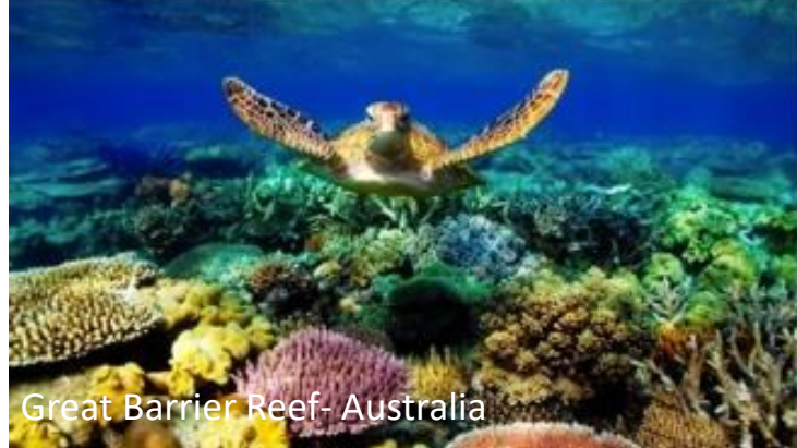
Great Barrier Reef- Australia