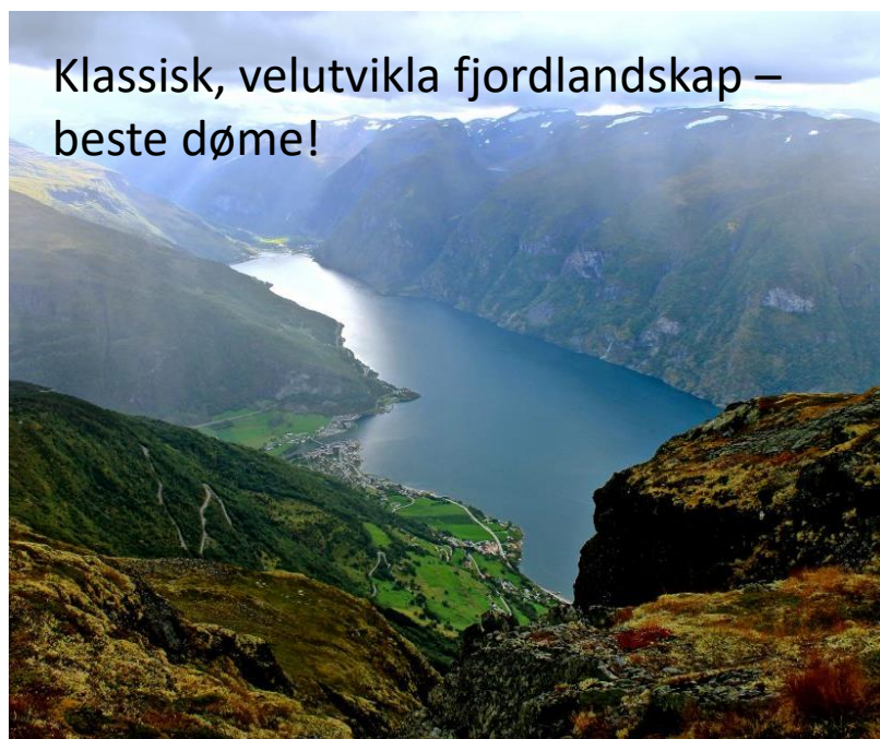
Klassisk, velutvikla fjordlandskap – beste døme!