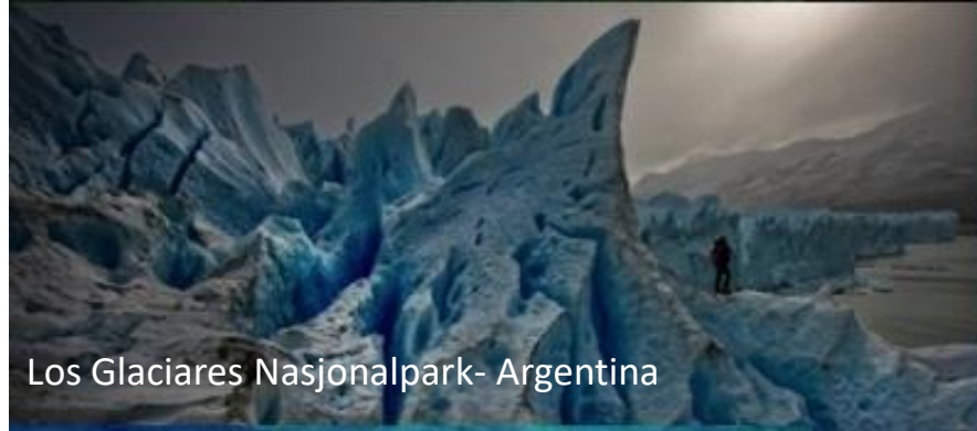
Los Glaciares Nasjonalpark- Argentina