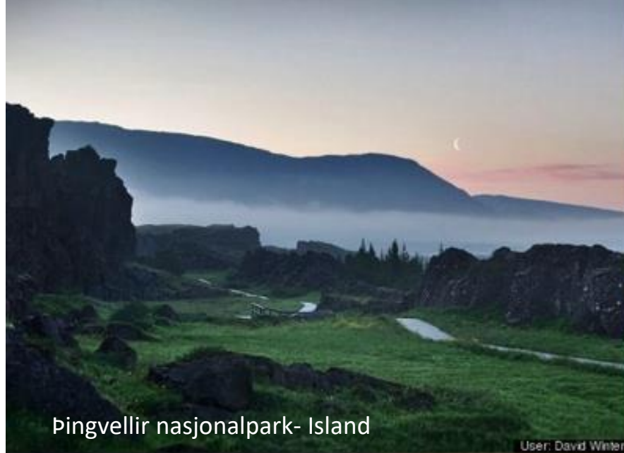
Þingvellir nasjonalpark- Island