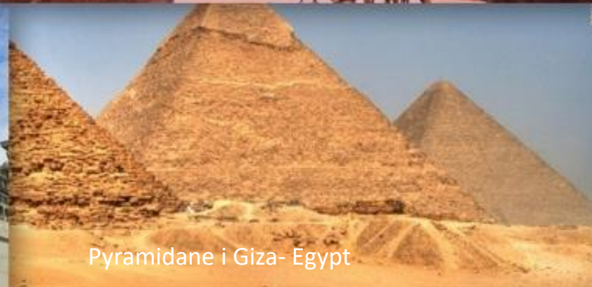
Pyramidane i Giza- Egypt