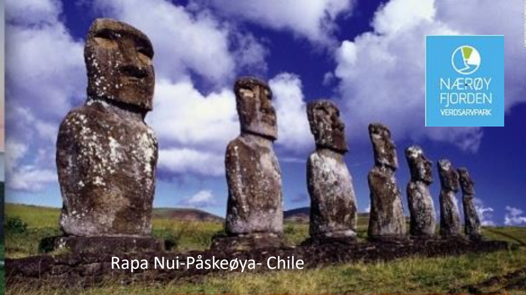
Rapa Nui-Påskeøya- Chile