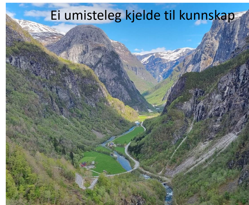
Ei umisteleg kjelde til kunnskap