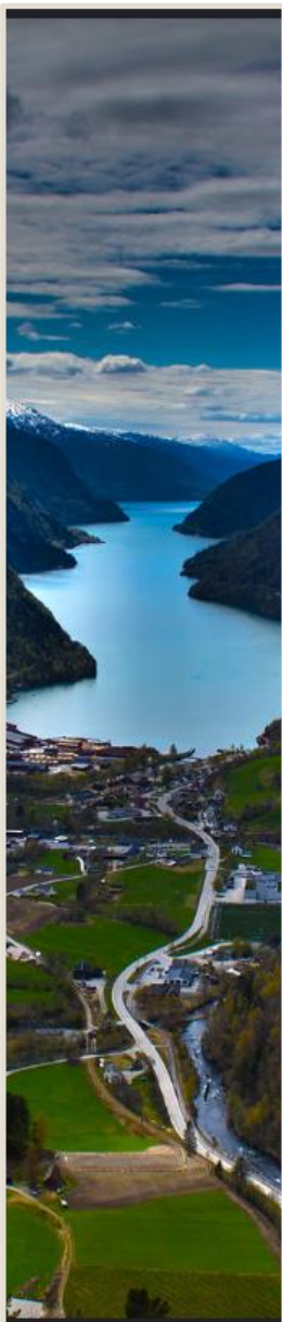
Granvin: fotografisk balanse.