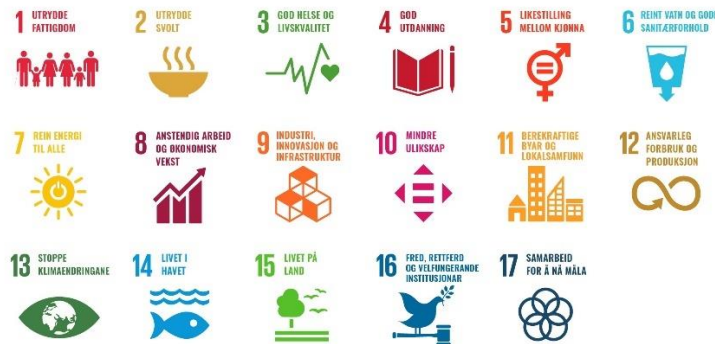
FN sine 17 berekraftsmål

Dei Nasjonale forventningane peikar innleiingsvis på at planlegginga skal fremja ei berekraftig utvikling, då med utgangspunkt i FN sine 17 berekraftsmål, nasjonale klima- og miljømål og føringar lagt i Plan- og bygningslova.