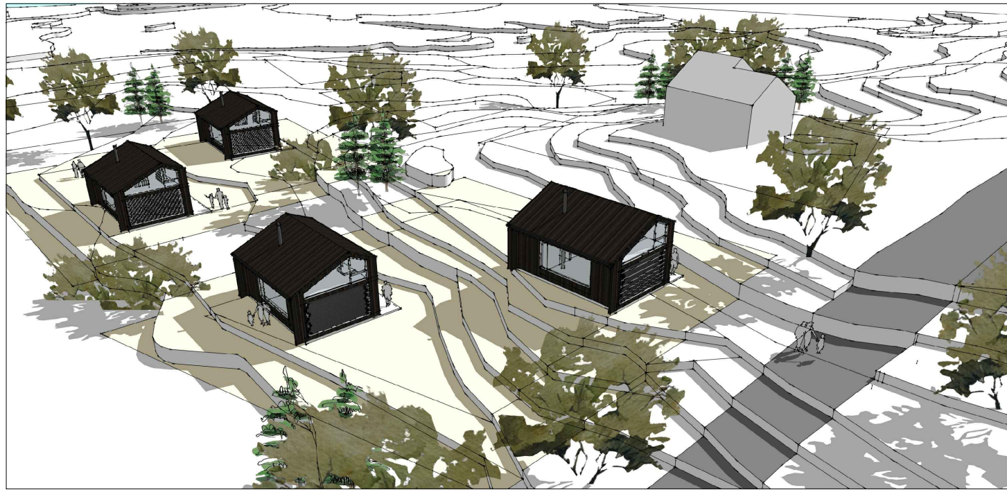
SETT FRÅ NORDVEST