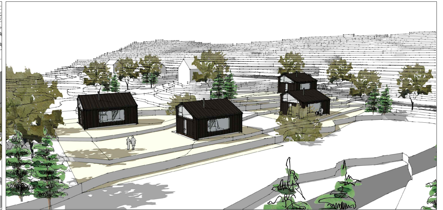
SETT FRÅ NORDAUST