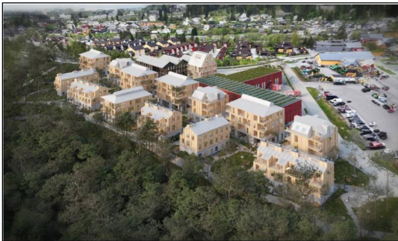
Oversiktsbilete av utbyggingsområdet sett frå aust.

Skisseprosjekt - illustrasjon frå planomtalen, utarbeida av Mad Vest AS.