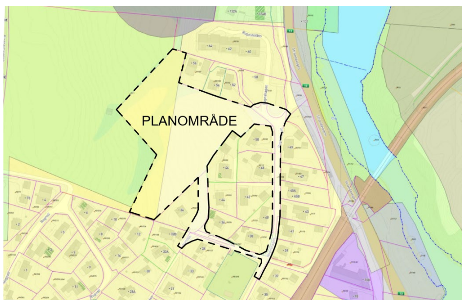
Kommuneplanen sin arealdel