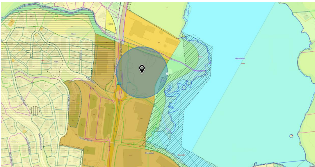
Utsnitt gjeldene kommuneplan, sentrumsformål

Vedlegg: Planavgrensing Planinitiativ Referat fra oppstartsmøtet Mulighetsstudie